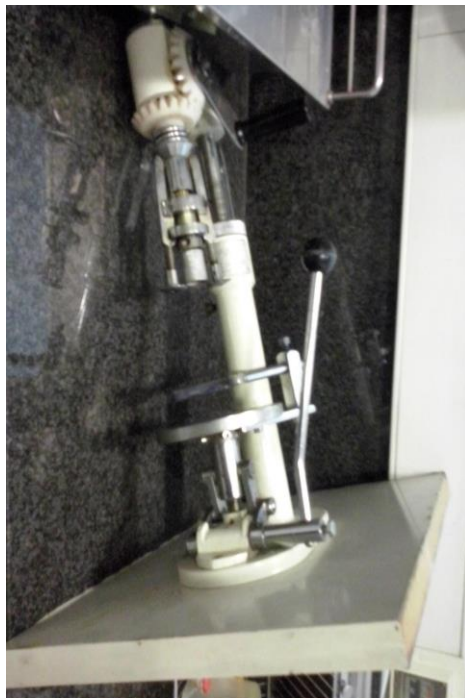
Foto del equipo en su estado actual, sin restaurar

4-DESCRIPCION: Rebordeador de rulas manual (mediante palanca) , marca Santiago Domenech (Barcelona), para el cierre de boquillas pulverizadoras con golletes de aluminio de frascos de perfumería y otros , modelo de sobremesa(sin mesa)