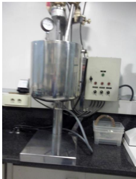
Foto del equipo en su estado actual

PRECIO: Equipo según estado , revisado y en marcha (ver nota abajo) .....€ 3.450,00 netos