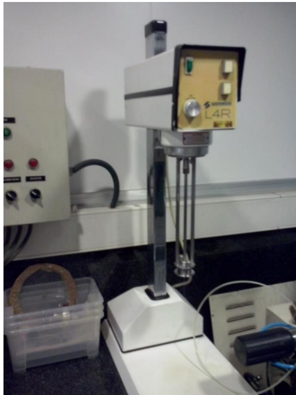
Foto del equipo en su estado actual

PRECIO: Equipo según estado, revisado y en marcha (ver nota abajo).....€ 2.250,00 netos